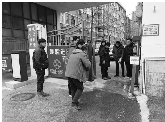
社区协助工人检查漏水原因

前几日,寒风瑟瑟,大风吹到处,水一不小心就会结成冰。一个寻常的冬日午后,光华东小区里,一位热心居民正悠闲地带着爱犬在院子里散步。不经意间,他发现小区院门的地面有些异样——一片湿漉漉的水迹格外显眼,正有水流缓缓地向外蔓延。这位热心肠的居民不敢耽搁,立刻将这一情况告知了自己所在光环社区的包片工作人员。