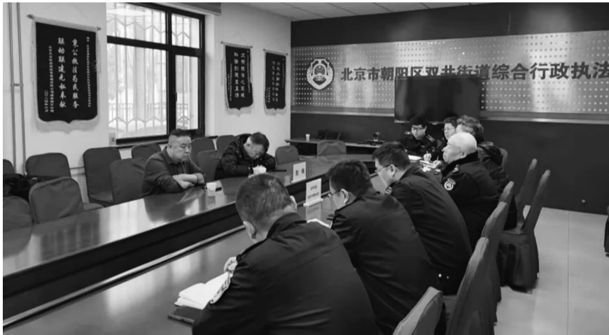
综合行政执法队、双井市场所作2025年度工作计划汇报

开展腾退工作,合力推进综改项目。三是加强联动,充分发挥执法平台作用,提升城市治理质效。