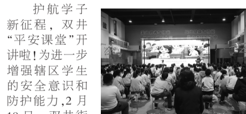
学生学习校园安全知识

护航学子新征程,双井“平安课堂”开讲啦!为进一步增强辖区学生的安全意识和防护能力,2月18日,双井街道办事处联合朝阳公安分局法制支队、双井派出所再次走进北京第二实验小学朝阳学校,共同开展“校园安全专题培训”活动,为广大莘莘学子讲授一堂安全教育“必修课”。