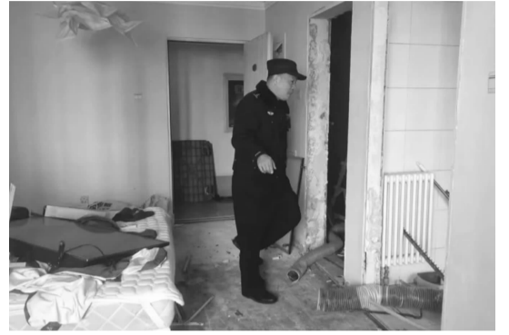
民警检查出租屋情况

紧密配合公安机关等相关部门,不断强化对辖区出租房屋的管理,保障辖区居民的生命财产安全。在此也提醒广大房屋出租人,务必严格遵守相关法律法规,切实履行出租房屋的管理责任,按规定申报登记承租人身份信息,定期检查房屋使用情况,共同维护良好的社会治安秩序。 ■文/何向蕊