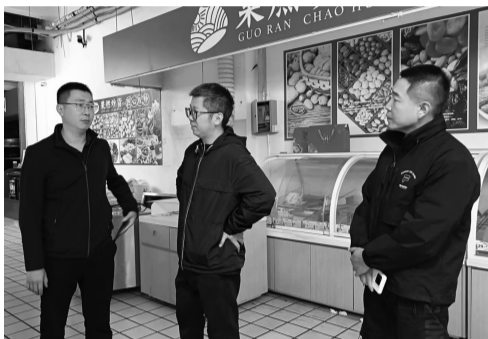
社区现场和商户协调