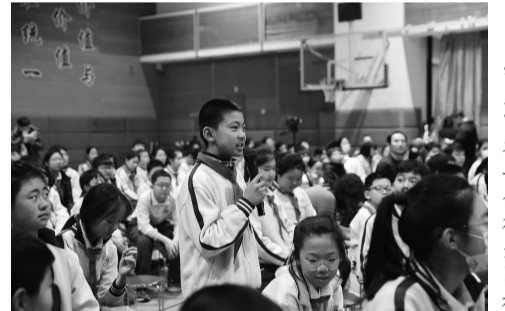
学生回答安全相关问题