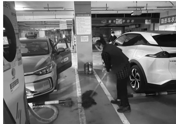
社区联合物业清理车库

近日,庆丰社区接到居民反映,百子湾苹果社区北区地下三层小桔充电桩附近卫生状况令人担忧,居民表示:“这地下车库的地面不仅散落着各种垃圾,还黏糊糊的,每次给车充电都得小心翼翼,生怕踩上去弄脏了鞋子,社区可得管管啊!”